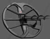
EQUX11™ 探盘, 带护板 11"圆形双D型 — 防水深度达5米 [16英尺]